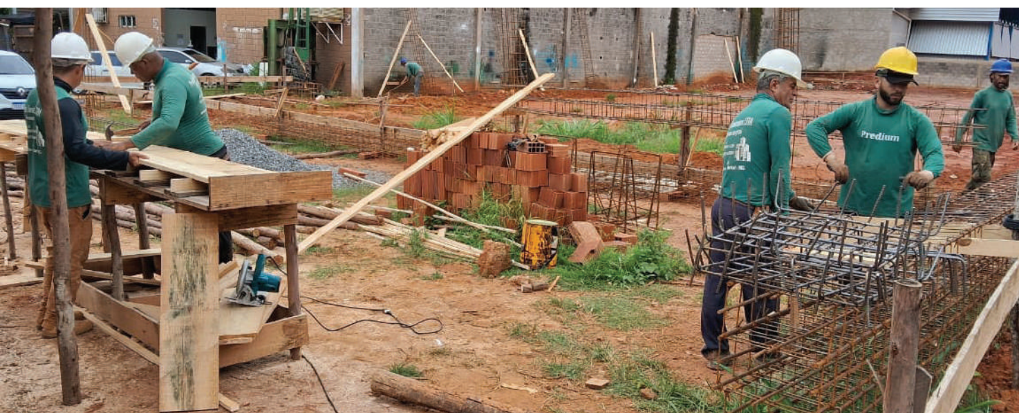
Profissionais trabalham na etapa de fundação do galpão e prédio administrativo a serem erguidos