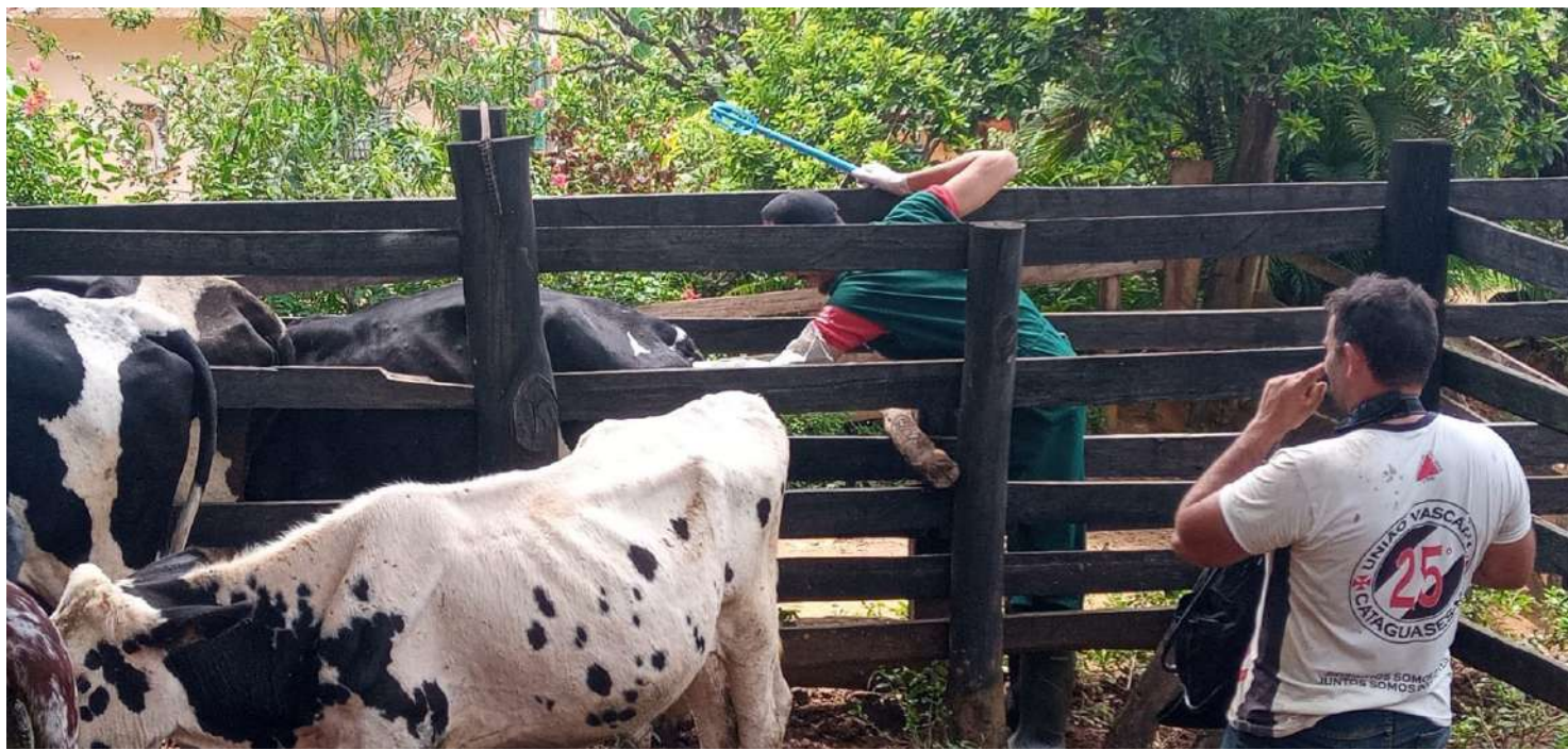
O melhoramento genético do gado é um dos principais objetivos do Programa, que está sendo desenvolvido em propriedades no distrito de Cataguarino, entre outros