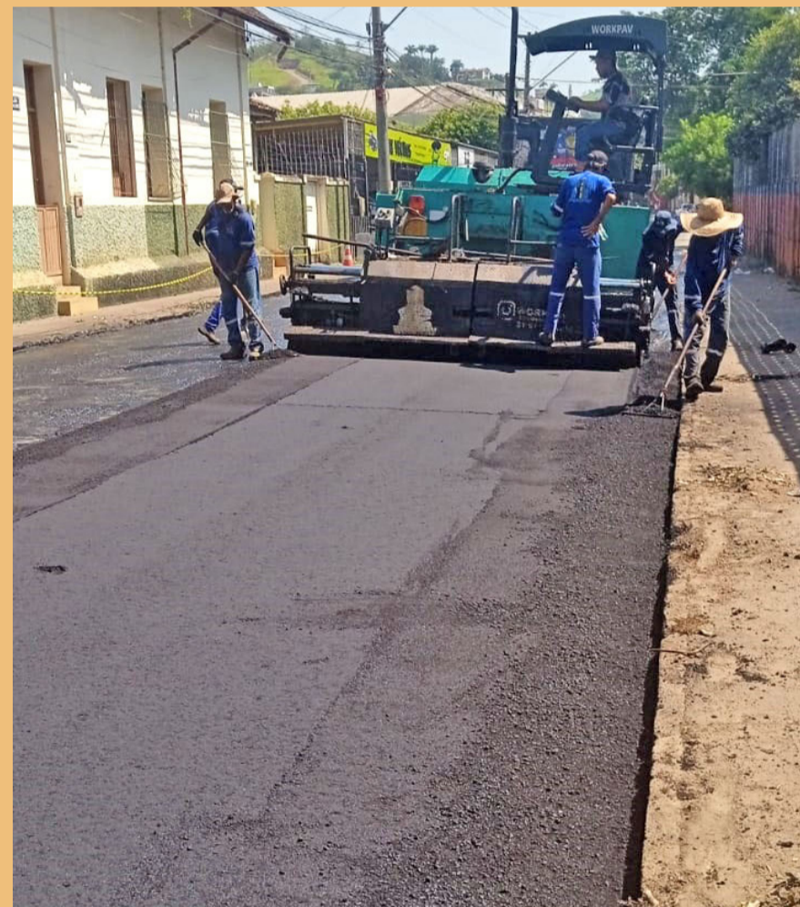
Rua Joaquim Augusto de Almeida