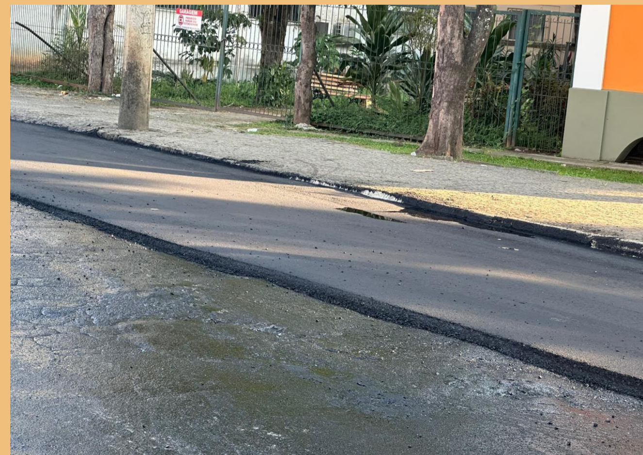
Contorno da Chácara Dona Catarina

Nesta semana, está em conclusão apenas a primeira etapa de um programa de pavimentação que deve atender outras ruas e avenidas da região central, de acordo com a Secretaria de Obras.