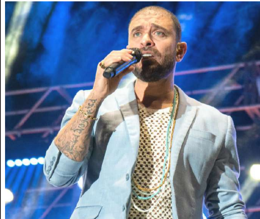
Show do cantor e compositor Diogo Nogueira, na festa de aniversário da cidade realizada pela Prefeitura, em uma noite considerada de pura energia e que vai ficar na memória de todos