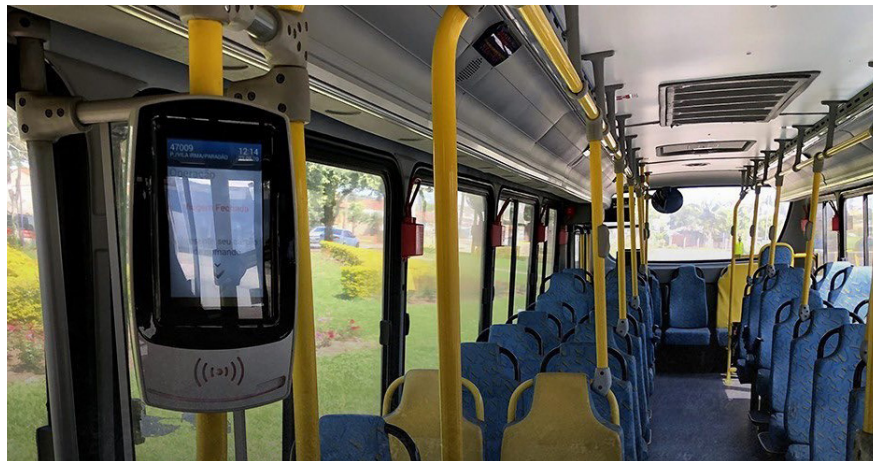
Cartão eletrônico é indispensável para melhor aproveitamento do sistema integrado