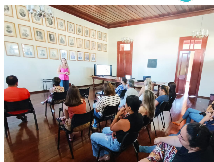
Palestra no Paço Municipal iniciando a Campanha

A profissional apresentou estatísticas nacionais e informações valiosas sobre fatores de risco e fatores protetores para a saúde mental. Na ocasião, enfatizou a importância crucial de abordar abertamente esse tema sensível, não apenas para aumentar o conhecimento, mas também para promover a conscientização e o entendimento. Ela ressaltou que a saúde mental é um aspecto essencial do bem-estar de