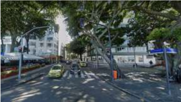
À esquerda, a rua Dr. Sobral em Cataguases, onde nasci (nessa casa de esquina com a rua do Pomba, hoje povoada por gatos) e vivi até os 19 anos. E à direita a Constante Ramos, em Copacabana, onde "cresci" por 18 dos 30 anos em que morei no Rio. À esquerda nessa foto o toldo do restaurante Mondego, esquina com a Avenida Atlântica, onde eu bebia e escrevia, escrevia e bebia: meu escritório dos anos 1980 até o final do século passado. Volta e meia volto ao Rio e almoço no Mondego, cujo nome remete ao rio Mondego, que conheci em Coimbra, quando participei do Portuguesia, um evento de poesia realizado em 2010 na Universidade de Coimbra e em Vila Nova de Famalicão, norte de Portugal.