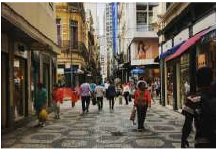
Rua Gonçalves Dias, onde morou o próprio poeta da Canção do Exílio: ontem e hoje