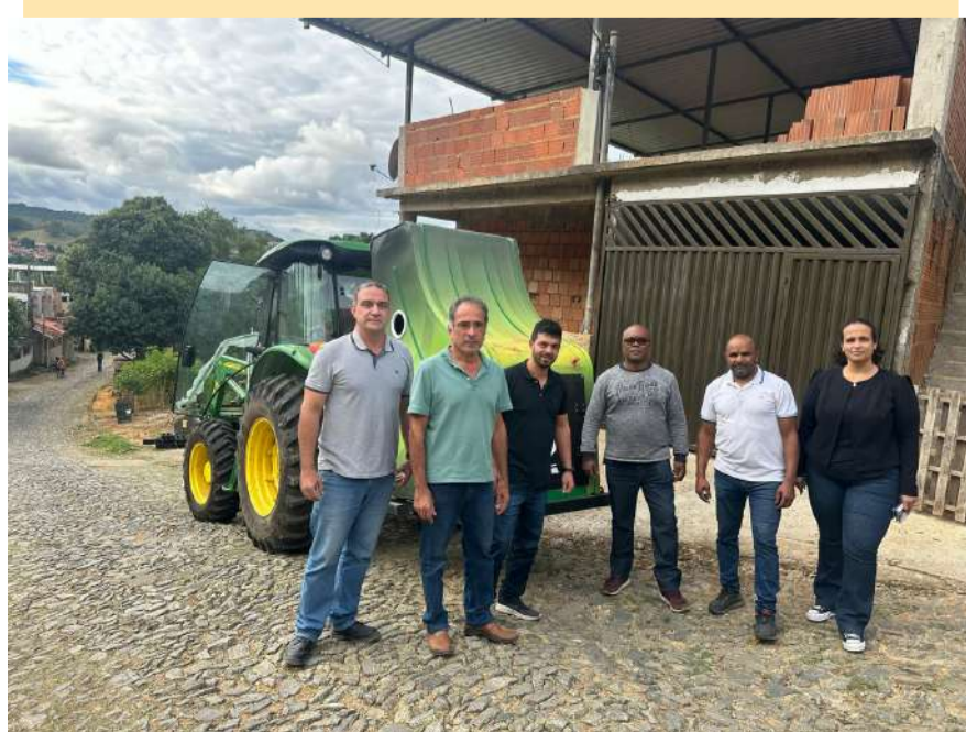
A equipe do Demlurb, de Juiz de Fora, esteve no Bairro Bela Vista para conhecer de perto as vantagens da capina elétrica

O inovador serviço de capina elétrica, adotado recentemente em Cataguases pela Administração Municipal, já repercute na região. Nesta terça-feira, dia 29, uma comitiva do Demlurb, Departamento de Limpeza Urbana da prefeitura de Juiz de Fora, esteve em nossa cidade para conhecer de perto as vantagens dessa tecnologia.