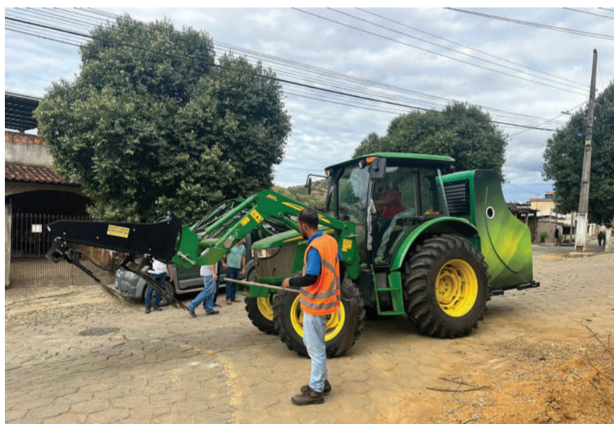
O conjunto mecânico, acoplado a um pequeno trator, faz pequenas descargas elétricas no solo matando a planta por onde passa