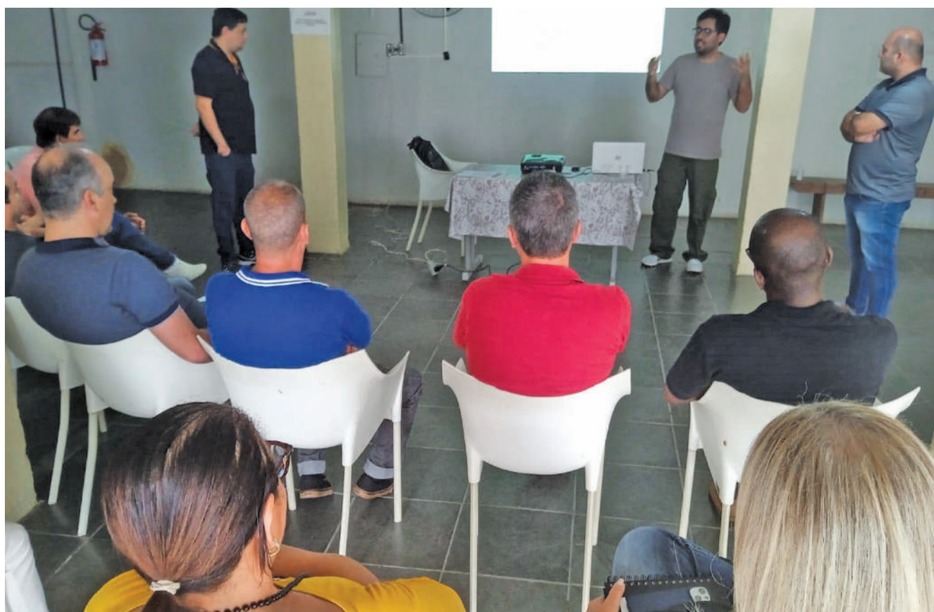
Participaram do encontro vereadores da comissão de Trânsito e Transporte da Câmara Municipal, representantes de empresas do setor e membros do Conselho Municipal de Trânsito e Transporte

A Catrans tem prazo de até 90 dias para a elaboração e apresentação final do Termo de Referência, que é o documento que norteia as regras do procedimento licitatório, em um processo que será ainda amplamente dialogado com a Câmara Municipal. Uma vez aprovado esse Termo de Referência, será aberto o prazo de 180 dias para a abertura da licitação do sistema de transporte coletivo em Cataguases.