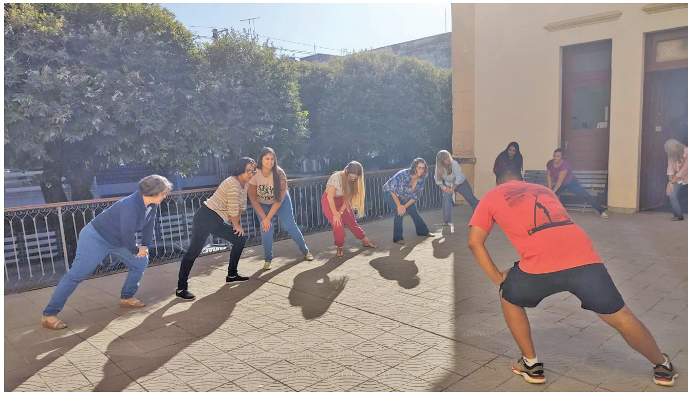
Alguns minutos de exercícios de alongamento na primeira hora do expediente contribui para a melhoria das condições de saúde dos servidores e vem se tornando rotina em diversos setores da Prefeitura

Como o projeto foi iniciado formalmente há menos de 30 dias, a equipe de trabalho do Servidor em Foco não passou por todos os setores. Aquele setor que não tiver recebido o atendimento e tenha interesse em receber as atividades, a orientação é que entre em contato com o setor de Recursos Humanos da Prefeitura, no telefone: 3429-2624.