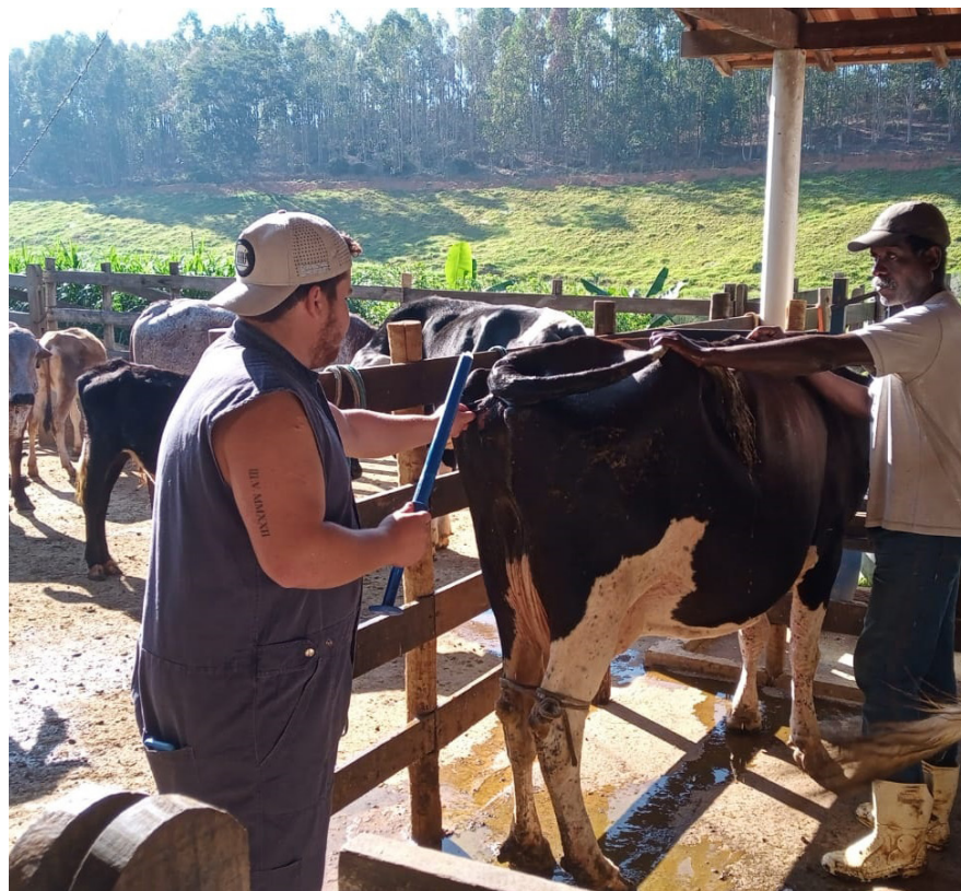
Os produtores contam com apoio gratuito de profissionais especializados, como veterinários e técnicos da Secretaria de Agricultura