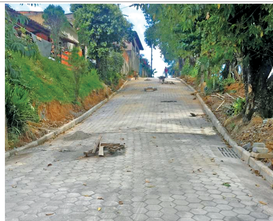
Obras quase concluídas na Rua Alcides José Machado