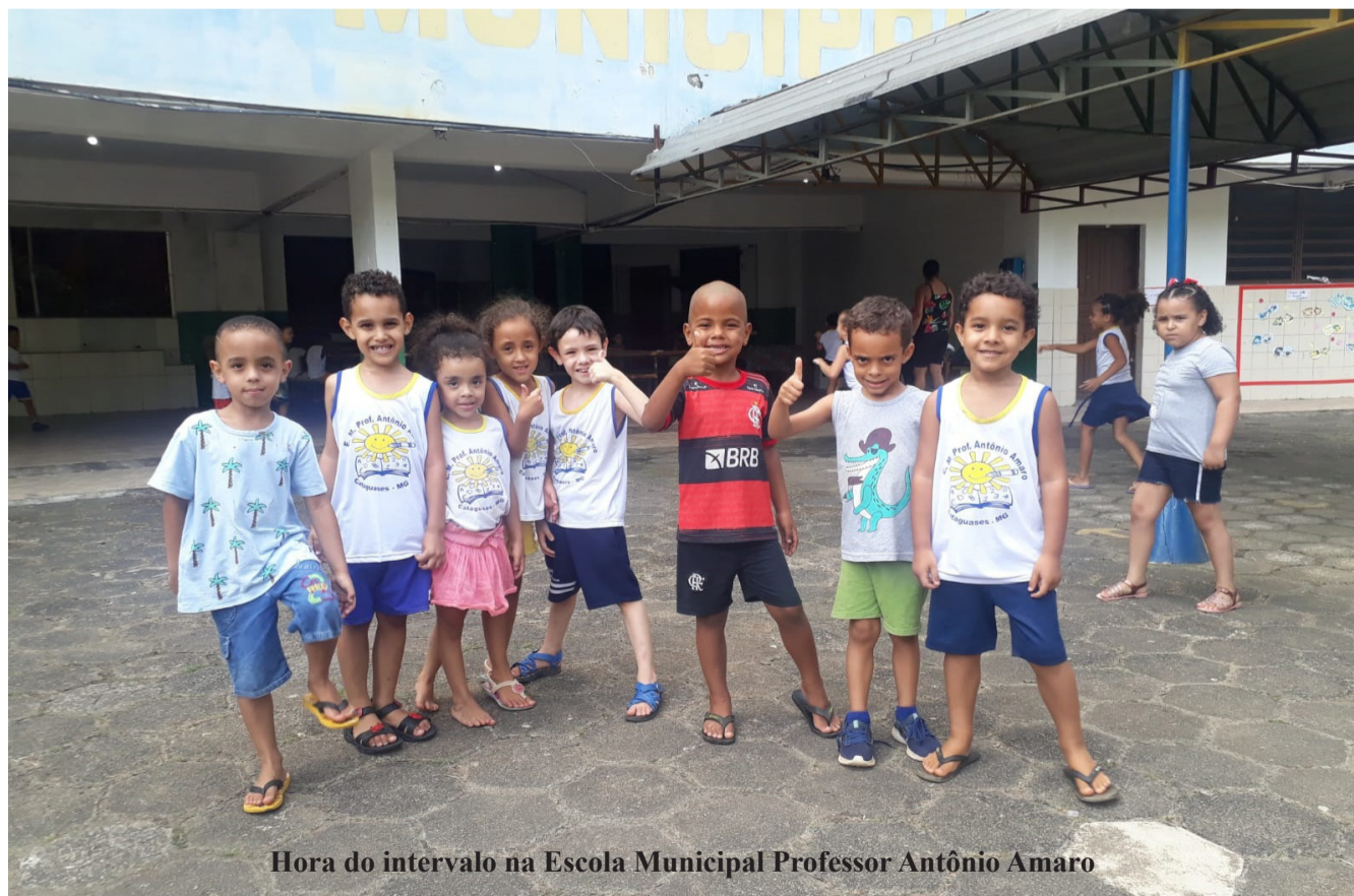
Hora do intervalo na Escola Municipal Professor Antônio Amaro