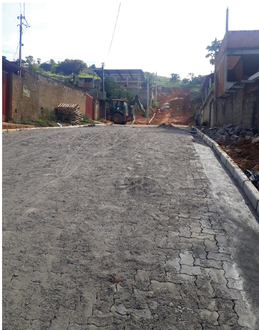
A Rua Ofélia Rabelo de Souza é a última das cinco ruas a receber as obras de infraestrutura de urbanização do loteamento João Pedro

A pavimentação foi em piso intertravado com blocos com 11 cm x 22 cm de lado e medindo oito centímetros de espessura, sendo a base de sustentação da rua em pó de pedra compactado. As obras já estão encerradas nas ruas Jarbas de Souza Melo, Jacira de Souza Silva, Jandira de Souza Reis e Maria de Melo. As ruas também vão receber placas refletoras de sinalização viária. ■