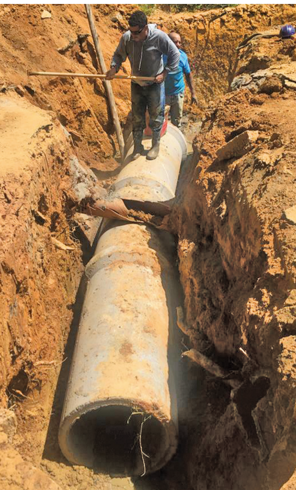
Rua Ofélia Rabelo de Souza: obras de drenagem