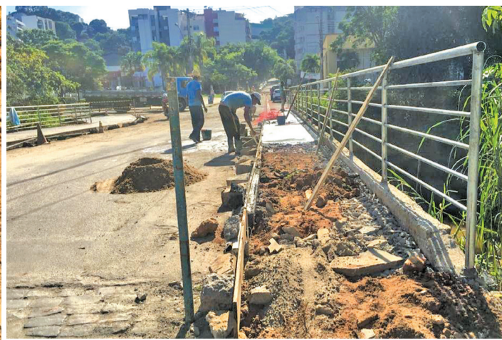
Novas calçadas na ponte de acesso ao trevo da Avenida Meia Pataca