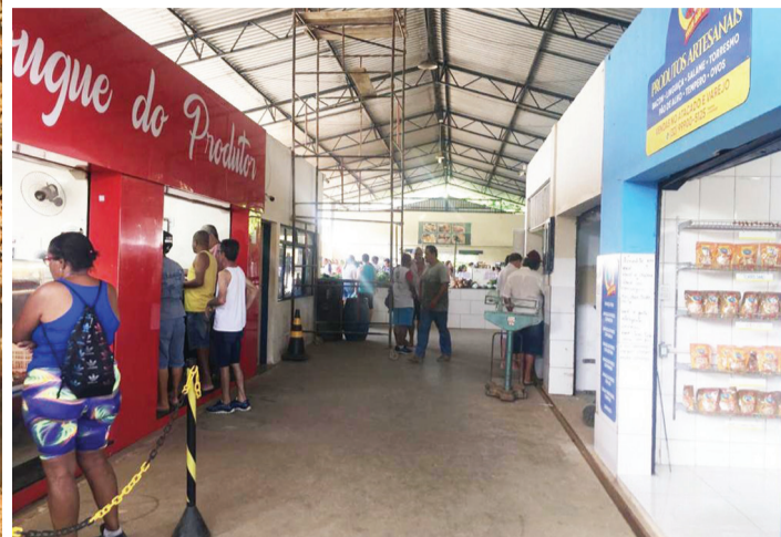
Mercado do Produtor segue em reforma