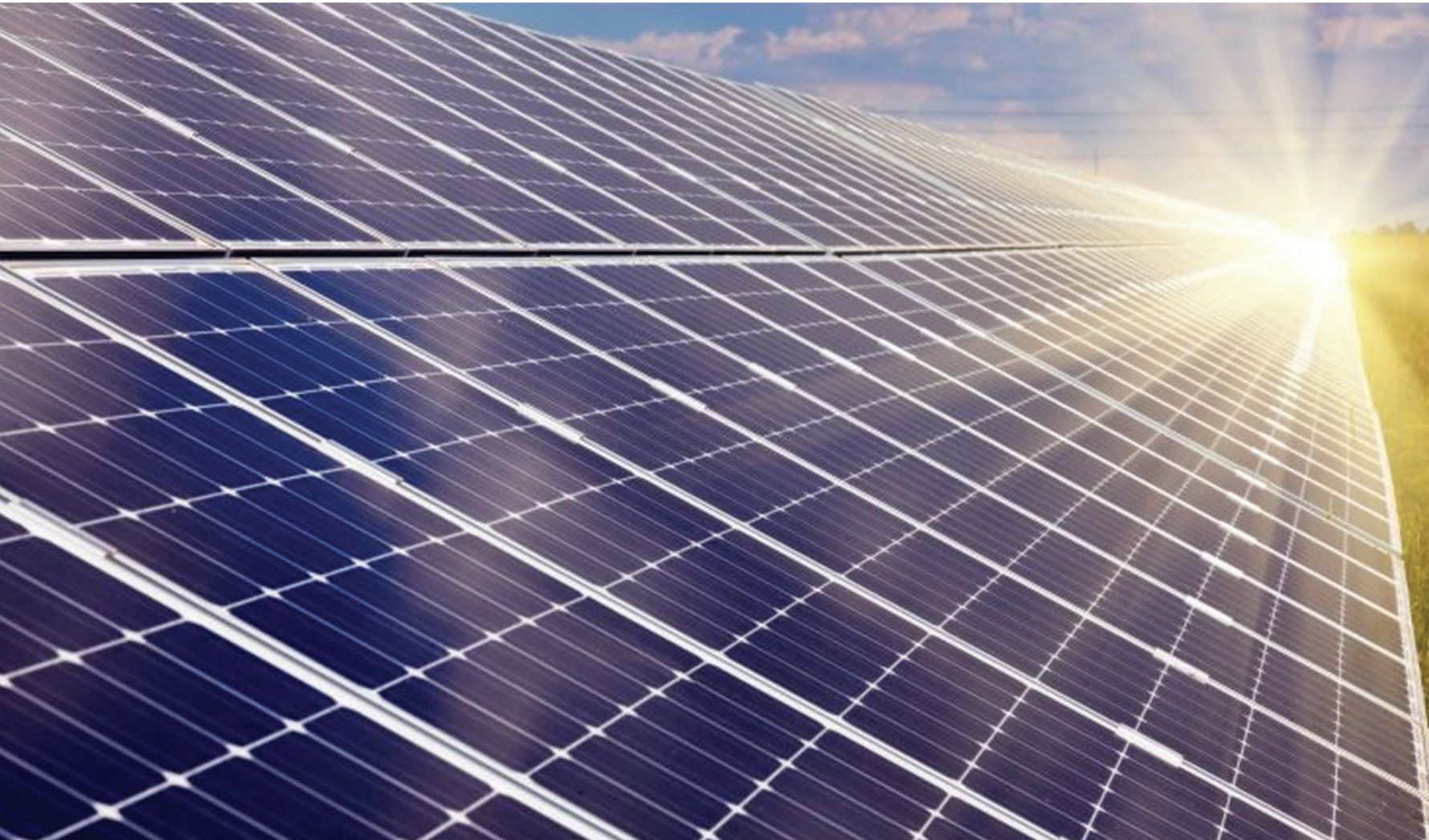
Entre os investimentos, 10 usinas fotovoltaicas serão instaladas para gerar energia limpa a partir da luz do sol (imagem ilustrativa)