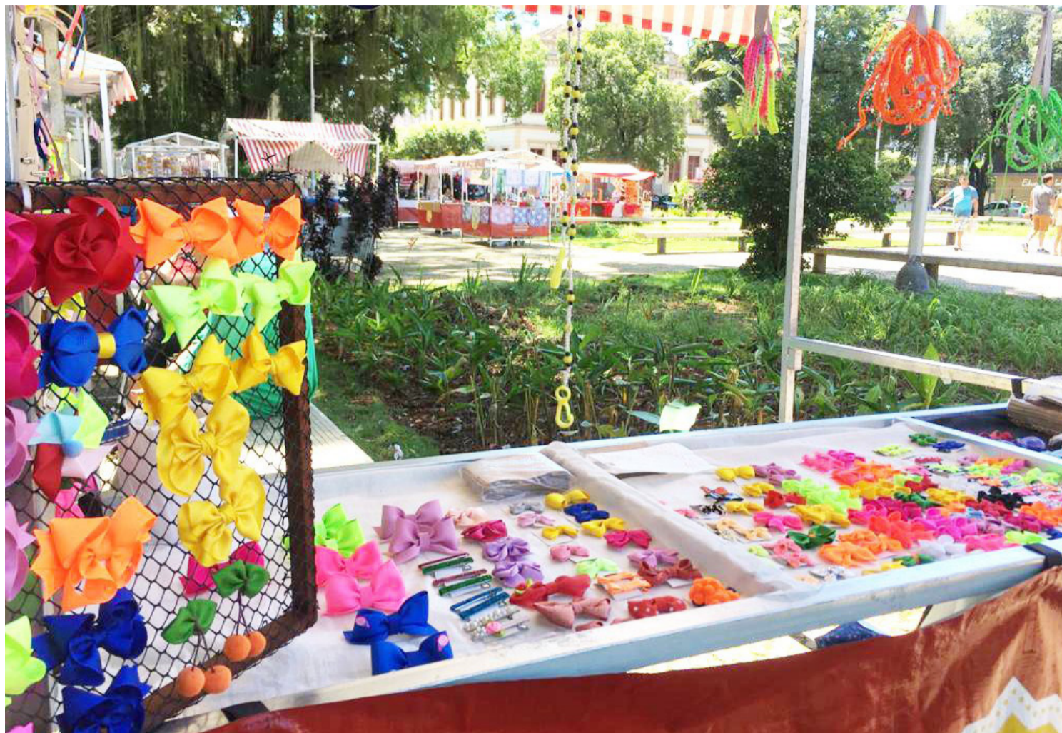
O espaço é o cenário perfeito para que os trabalhadores possam comercializar suas obras e apresentar suas habilidades

Com 29 anos de existência, a Feira de Artesanato celebra sua história valorizando os talentos profissionais da cultura e arte na cidade. Instituída pela Prefeitura no ano de 1994 e hoje administrada pelas secretarias municipais de Desenvolvimento Social e Desenvolvimento Econômico e Gestão Institucional, a Feira reúne 32 expositores que mostram suas habilidades e oferecem seus trabalhos aos visitantes. “Além de gerar renda aos expositores, é uma ótima oportu-