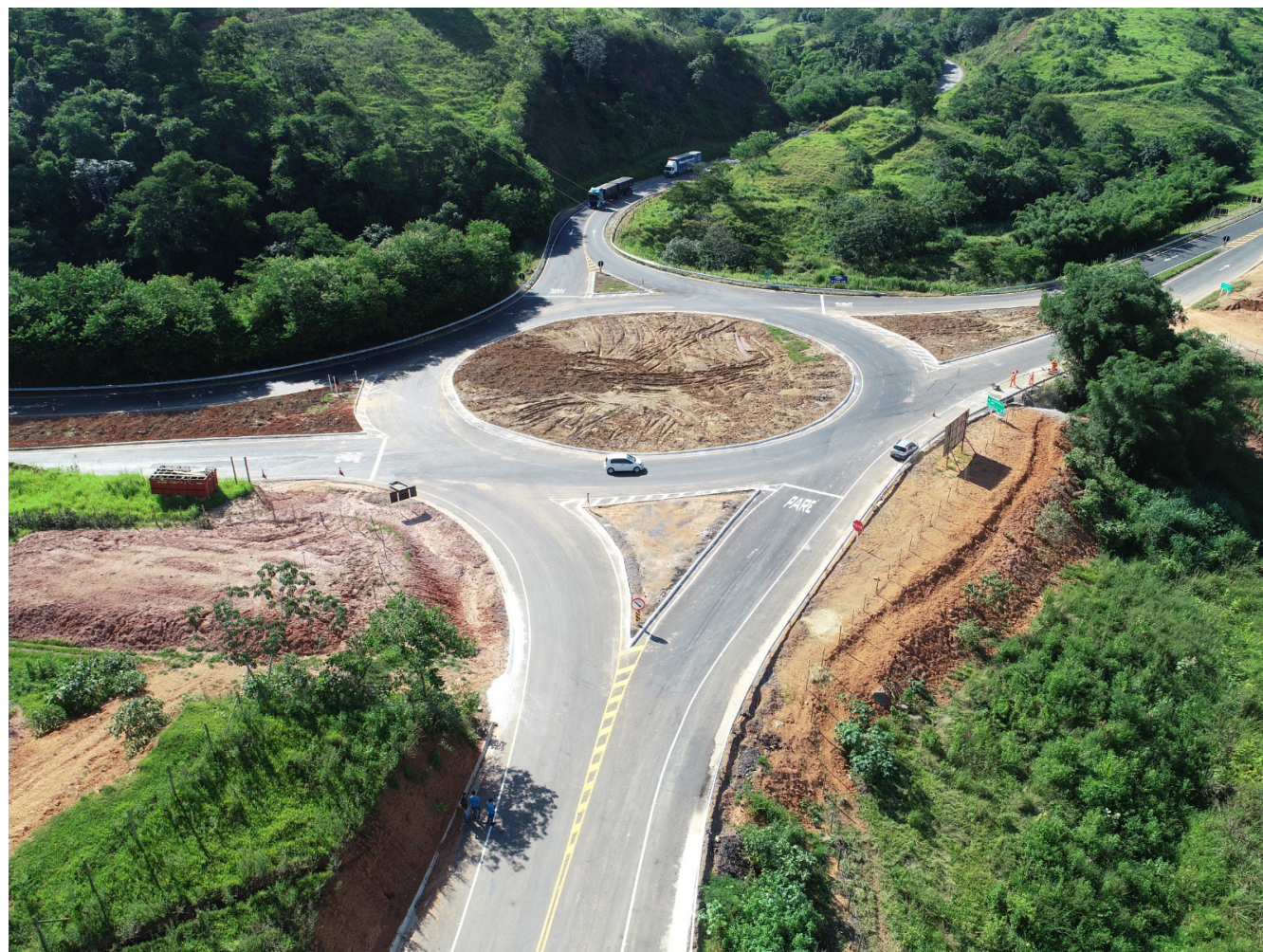
O Contorno de Cataguases será a principal via de acesso ao futuro Terminal Rodoviário e uma importante conexão com demais ramais rodoviários BR-120 e BR-116, trazendo melhores condições de trafegabilidade, segurança para motoristas e pedestres, além desafogar o trânsito de caminhões e veículos pesados por dentro da cidade

Projetada para ligar o Distrito Industrial de Cataguases à Rodovia BR - 120, a obra sempre foi considerada como fundamental para o crescimento da região dos bairros Taquara Preta e Justino. Vale lembrar ainda que, no segundo mandato do prefeito Tarcísio Henriques (2005-2008) foi elaborado um Plano Diretor de Desenvolvimento Urbano que já apontava para o inevitável avanço do município naquela região, o que motivou a construção da terceira ponte sobre o Rio Pomba, ligando os bairros Justino e Taquara Preta, bem como um plano para a instalação de um novo Terminal Rodoviário.