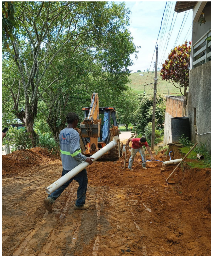
Rua Alcides José Machado

No bairro Ibraim está acontecendo mais um projeto de melhoria da infraestrutura urbana, com cinco ruas sendo pavimentadas. Na quarta-feira, dia 8, uma equipe da Minas Florestais Construções dava continuidade ao trabalho na Rua Jacira de Souza Silva, onde estão sendo instalados blocos de 16 lados com dimensões de 22x11 cm e 8 cm de espessura para pavimentar uma área de 1.401,41 metros quadrados. ■