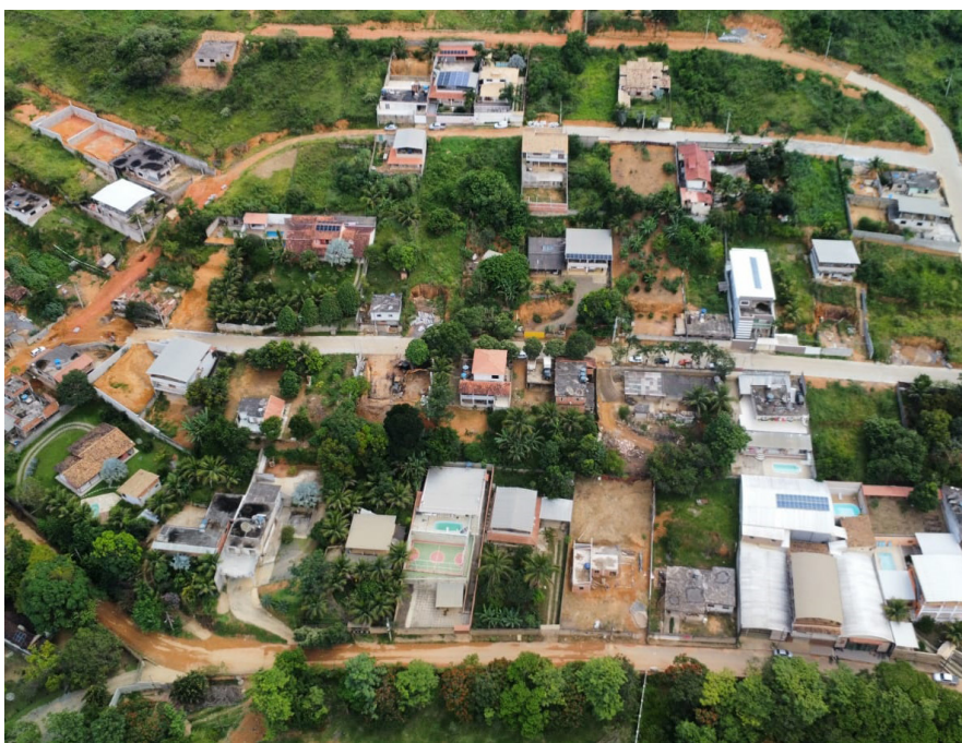
Loteamento João Pedro