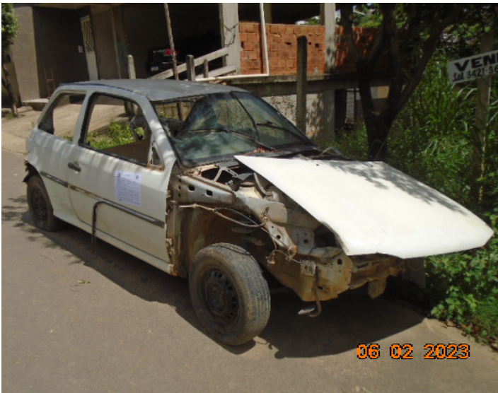
GOL (Branco) AJJ-6346 Cataguases-MG- DF 1089 - Rua Gensericó Gomes de Oliveira, 121 Dico Leite

Veículos em situação de abandono e etiquetados, portanto passíveis de apreensão, conforme o disposto na Lei 4117/2014