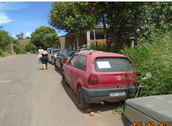
GOL (Vermelho) GKX-5802 Cataguases-MG- DF 1088 - Rua Gensericó Gomes de Oliveira, 121, Dico Leite