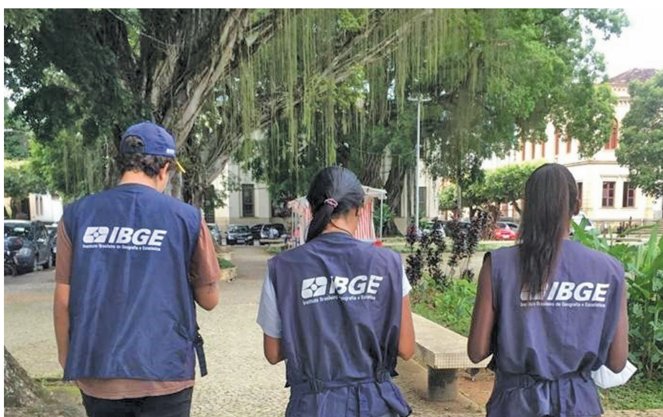
Os recenseadores estão sempre uniformizados com o colete do IBGE, crachá de identificação e portam o Dispositivo Móvel de Coleta. A agência do IBGE em Cataguases está localizada na rua Coronel Vieira, número 40 - sala 204, atendendo das 8h às 17h, telefone (32) 3421-1788