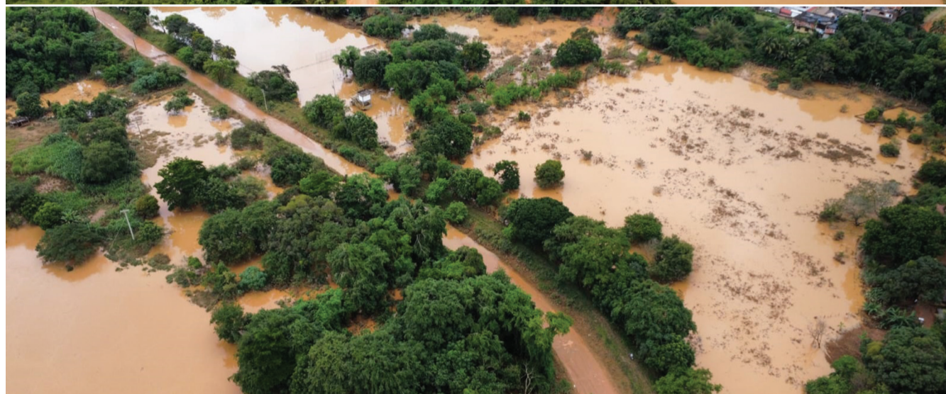
Cheia do Rio Pomba chegou a 7,5 metros alagando as partes baixas do Centro e áreas ribeirinhas. As chuvas causaram novos deslizamentos de encostas e o Governo de Minas encaminhou ajuda humanitária às vítimas