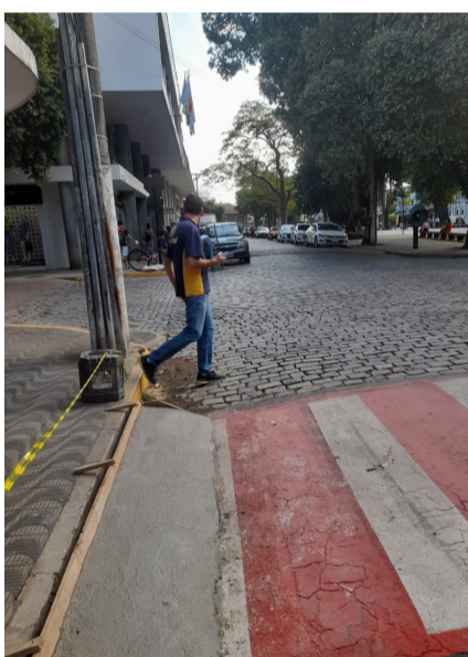
Obra de acessibilidade e reparos em grelha de drenagem - Praça Rui Barbosa