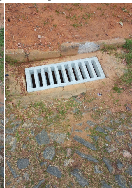
Manutenção em bueiro na Vila Minalda (antes e depois)