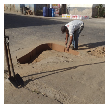
Manutenção de meio-fio na esquina das ruas Dr. Norberto Custódio Ferreira e Joaquim Augusto de Almeida