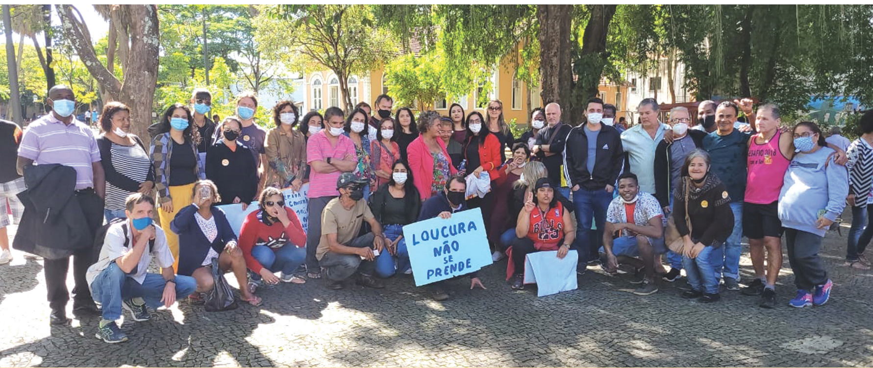
Café da manhã, passeata, panfletagem e um almoço comunitário marcaram o 18 de Maio do CAPS Saúde Mental em Cataguases

Em 18 de maio foi comemorado, em todo o país, o Dia Nacional da Luta Antimanicomial. A data marca as mobilizações em torno do fechamento de manicômios e a formalização de novas legislações, a implantação da rede de saúde mental e atenção psicossocial e da instauração de novas práticas em um importante movimento de Referência Psiquiátrica Brasileira, uma referência internacional.